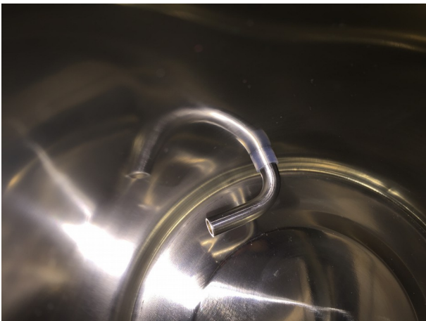
Absaugbogen von innen in Schlauch stecken.