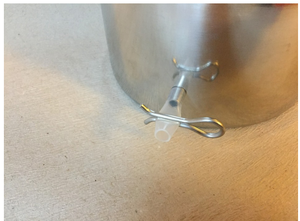
Schlauch mit Schlauchklemme verschließen.

Zum Reinigen in umgekehrter Reihenfolge zerlegen (erst Absaugbogen nach innen, dann Schlauch nach außen ziehen).