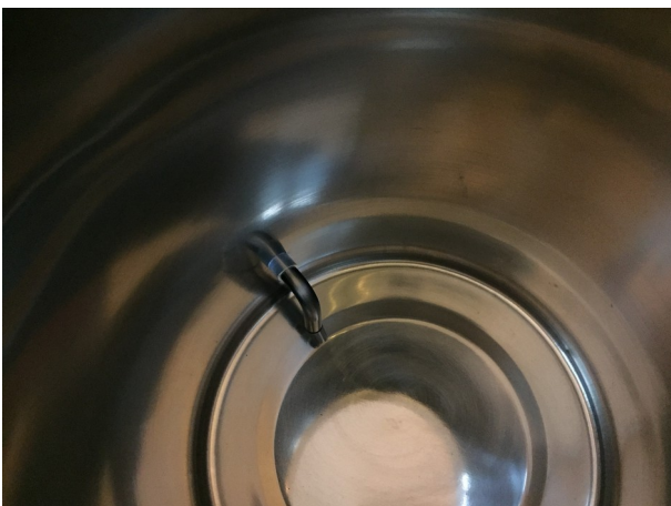
Absaugbogen nach unten drehen.